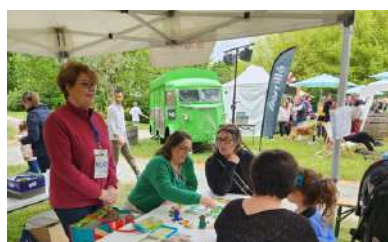
L'équipe du Café des Bénévoles, avec ses jeux d'extérieur !